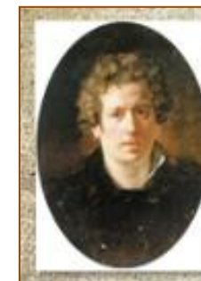
http://bryullov.ru — К. П. Брюллов

http://qps.ru/50xTL — викторина (совместная работа с подростком).