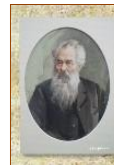
http://shishkin-art.ru — И. И. Шишкин

По ссылкам мы нашли материал о художниках: биографии, особенности творчества, описание картин.